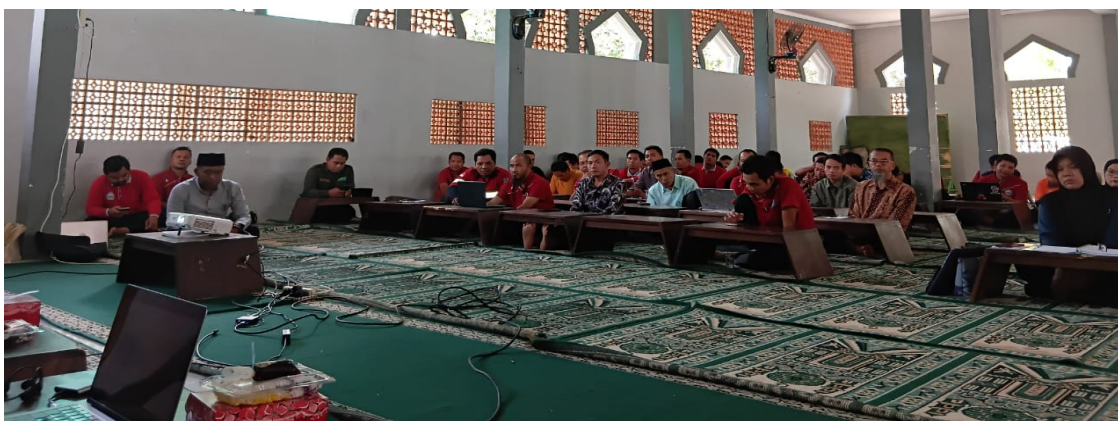
Gambar 1. Proses Pelaksanaan Workshop

Workshop pemanfaatan Artificial Intelligence (AI) dan coding dalam pembelajaran ini dilaksanakan secara tatap muka di lingkungan masjid sebagai ruang belajar komunal yang inklusif dan mudah diakses oleh peserta. Pemilihan lokasi ini tidak hanya mempertimbangkan aspek ketersediaan fasilitas, tetapi juga dimaksudkan untuk menciptakan suasana belajar yang kondusif, partisipatif, dan berorientasi pada penguatan kolaborasi antarguru, sebagaimana tergambar pada Gambar 1.