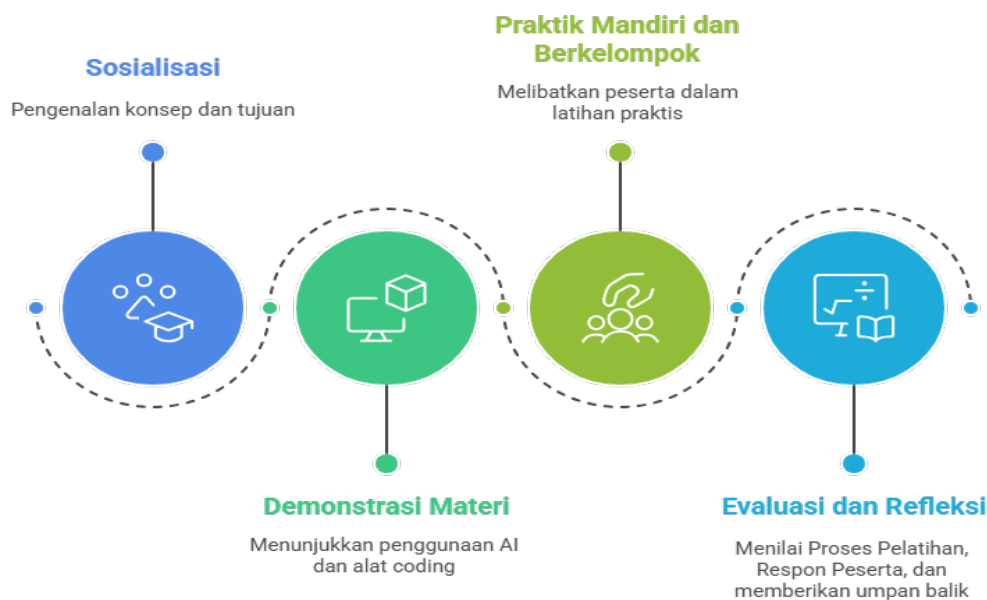
Gambar 1. Alur Kegiatan Pengabdian. (Ilustrasi di buat menggunakan Napkin Ai)

AI dengan karakteristik peserta didik serta tuntutan dunia kerja vokasional (Pratiwi et al., 2025). Dengan demikian, metode workshop berbasis praktik langsung tidak hanya mendorong keterlibatan aktif peserta, tetapi juga memfasilitasi pembelajaran kontekstual yang relevan, berkelanjutan, dan selaras dengan kebutuhan pengembangan kompetensi abad ke-21 (Laru et al., 2024; Ejaz et al., 2022). Workshop dilaksanakan melalui empat tahapan sistematis, seperti yang disajikan pada gambar 1: