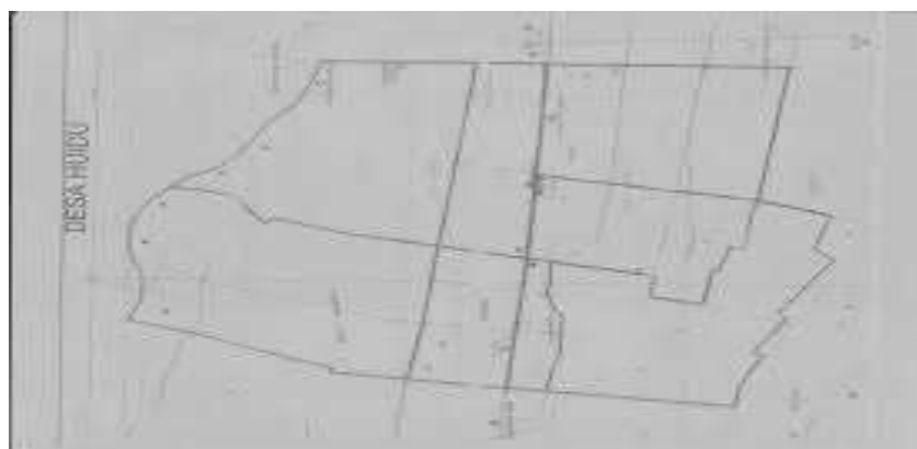
Gambar 1. Peta desa Huidu