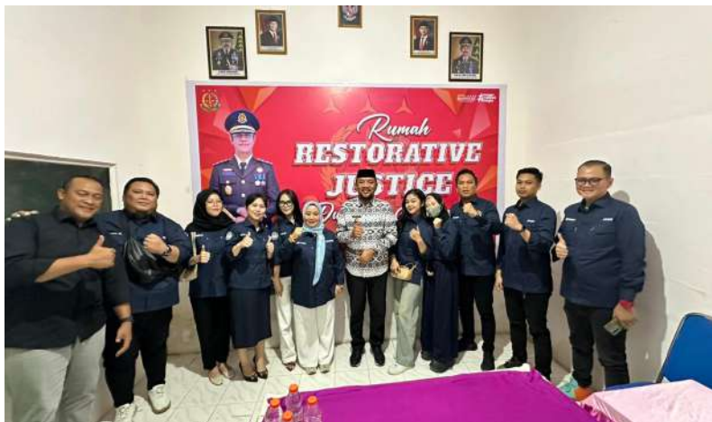
Gambar 4. Rumah Restorative Justice