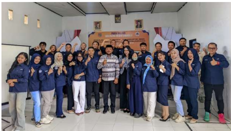
Gambar 5. Foto Bersama aparat desa huidu dan mahasiswa Magister hukum pascasarjana UNG