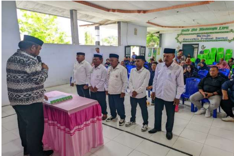
Gambar 3. Pengukuhan mediator desa huidu