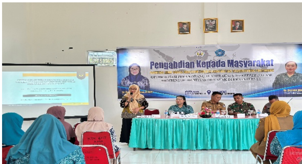
Gambar 2. Tim PkM FISIP Untan Melakukan Sosialisasi

kebiasaan, nilai dan aturan dari satu generasi ke generasi lainnya dalam satu kelompok atau masyarakat (Elyas, Iskandar and Suardi, 2020, p. 137). Tahapan ini dapat dilihat dari gambar di bawah ini.