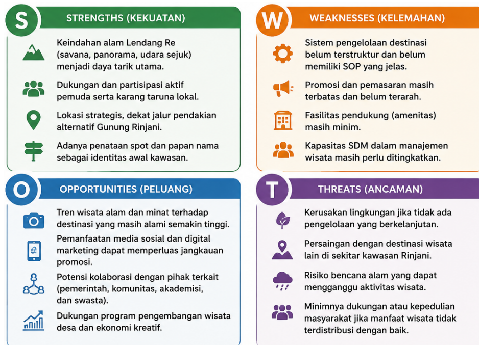
Gambar 5. Analisis SWOT Destinasi Lendang Re

Hasil kegiatan menunjukkan adanya perubahan pada aspek visual kawasan. Area yang sebelumnya belum memiliki identitas kini memiliki titik representatif yang mudah dikenali dan layak menjadi latar dokumentasi pengunjung. Berdasarkan hasil analisis SWOT yang disajikan pada Gambar 5, diketahui bahwa kekuatan utama Destinasi Lendang Re terletak pada keindahan lanskap alam serta dukungan aktif pemuda lokal dalam pengembangan kawasan. Di sisi lain, kelemahan utama masih berada pada sistem pengelolaan destinasi yang belum terstruktur, kapasitas sumber daya manusia yang masih terbatas, serta promosi wisata yang belum optimal. Analisis tersebut juga menunjukkan adanya peluang pengembangan melalui meningkatnya minat terhadap wisata alam, pemanfaatan media digital, dan potensi kolaborasi dengan berbagai pemangku kepentingan, meskipun tetap dihadapkan pada ancaman berupa persaingan antar destinasi, risiko bencana alam, dan potensi kerusakan lingkungan. Berdasarkan kondisi tersebut, penataan spot dan pemasangan 1 (satu) papan nama sebagai identitas kawasan merupakan strategi awal yang relevan untuk memperkuat aspek amenities dan branding destinasi. Intervensi ini diharapkan menjadi fondasi dalam pengembangan Destinasi Lendang Re sebelum memasuki tahap penguatan kelembagaan, peningkatan aksesibilitas, penyediaan fasilitas pendukung, serta pengembangan promosi wisata yang lebih komprehensif (Mahendra & Rahmawati, 2025; Risyanti, et al. , 2024).