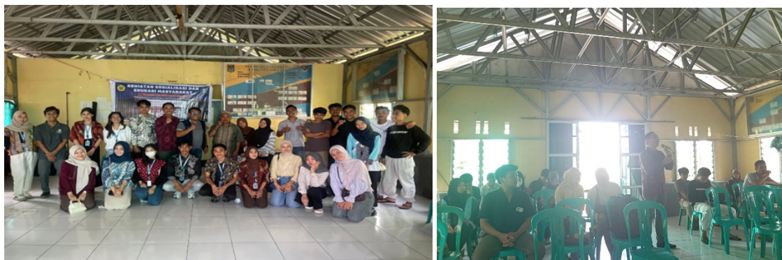
Gambar 3. Kegiatan Penyuluhan

penguatan kapasitas kognitif dan kesadaran kolektif masyarakat. Intervensi edukatif yang difasilitasi oleh narasumber dengan latar belakang akademik dan praktik lapangan terbukti efektif dalam mendorong transformasi awal tata kelola destinasi berbasis potensi lokal secara berkelanjutan. Gambar 3 memperlihatkan kegiatan penyuluhan pengembangan dan manajemen destinasi wisata berbasis potensi lokal yang dilaksanakan sebagai upaya peningkatan kapasitas masyarakat dalam mengelola dan mengembangkan Destinasi Lendang Re secara terencana, partisipatif, dan berkelanjutan. Peserta terdiri atas unsur pemerintah desa, karang taruna, dan pemuda setempat yang berperan sebagai calon pengelola destinasi wisata.