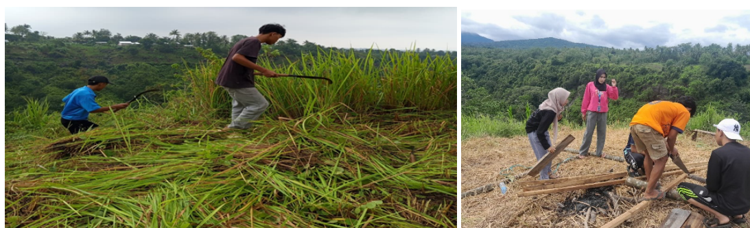
Gambar 4. Gotong royong penataan destinasi wisata

Intervensi utama dilakukan melalui pembersihan kawasan, penataan titik pandang, serta pembangunan dan pemasangan papan nama “Lendang Re” sebagai identitas resmi destinasi. Proses ini dilaksanakan secara gotong royong dengan melibatkan unsur pemuda Desa Selengen, khususnya Remaja Tangge, yang berperan aktif sejak tahap persiapan hingga finishing. Partisipasi kolektif tersebut tidak hanya mempercepat proses fisik pembangunan, tetapi juga memperkuat rasa kepemilikan sosial terhadap destinasi. Dalam perspektif pengembangan berbasis komunitas, gotong royong menjadi modal sosial penting yang menentukan keberlanjutan pengelolaan wisata. Gotong royong unsur pemuda Desa Selengen dan Tim Mahasiswa KKN Universitas Mataram dapat dilihat pada Gambar 4.