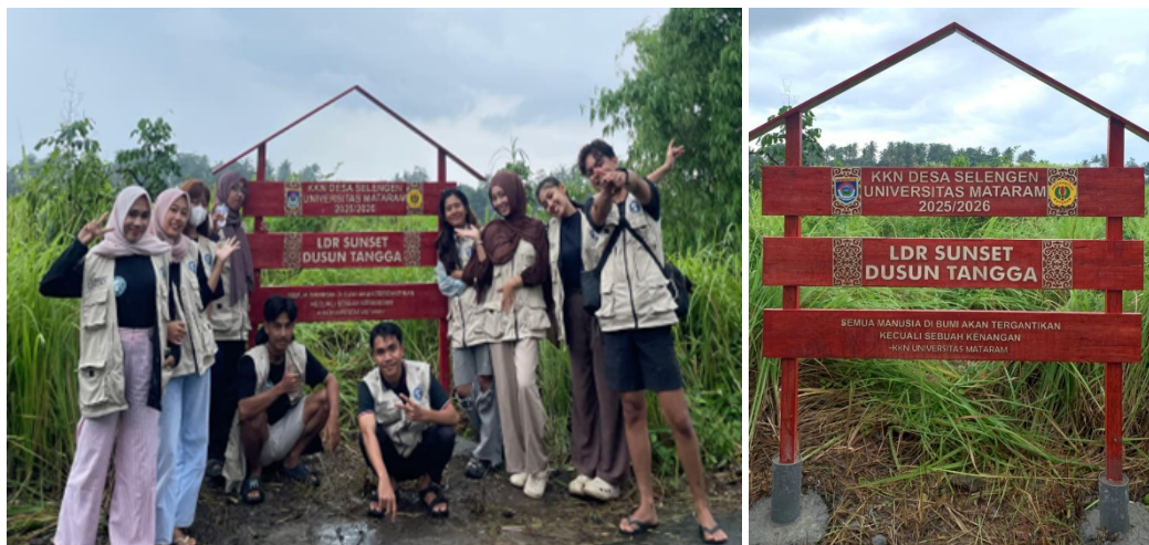
Gambar 6. Papan nama destinasi wisata Lendang Re

Kegiatan penataan spot Destinasi Lendang Re merepresentasikan transformasi ruang alami menjadi ruang wisata yang memiliki identitas, makna sosial, dan arah pengelolaan. Gotong royong pemuda desa menjadi faktor kunci dalam memastikan bahwa intervensi fisik tersebut tidak berhenti pada pembangunan fasilitas, tetapi berkembang menjadi fondasi penguatan tata kelola dan kesadaran kolektif dalam inisiasi pengembangan desa berbasis potensi lokal secara berkelanjutan. Hasil pembuatan papan nama destinasi wisata Lendang Re Dusun Tangga Desa Selengen dapat dilihat pada Gambar 6.