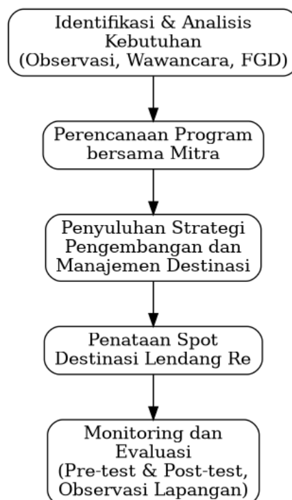
Gambar 1. Tahapan Kegiatan Pengabdian

Metode pelaksanaan menggunakan pendekatan partisipatif berbasis pemberdayaan masyarakat (participatory community development) dengan tahapan yang meliputi identifikasi masalah, perencanaan program, pelaksanaan intervensi, serta evaluasi hasil (Indrawan et al. , 2024). Metode ini dirancang untuk menghasilkan penguatan kapasitas kelembagaan sekaligus peningkatan kualitas daya tarik destinasi sebagai fondasi inisiasi pengembangan desa berbasis potensi lokal di Desa Selengen. Tahapan kegiatan dapat dilihat pada Gambar 1.